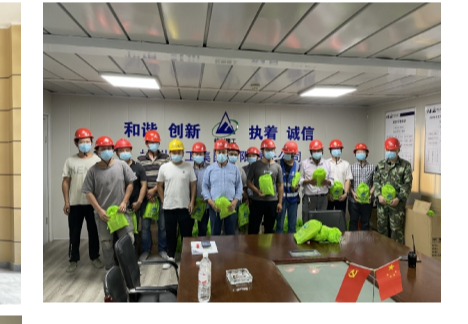
三分公司对所属项目开展高温慰问