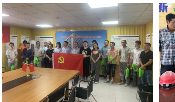
机关一支部慰问下沙财经大学项目和[2020]75号地块项目