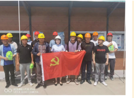
市政分公司党支部慰问黎明路项目