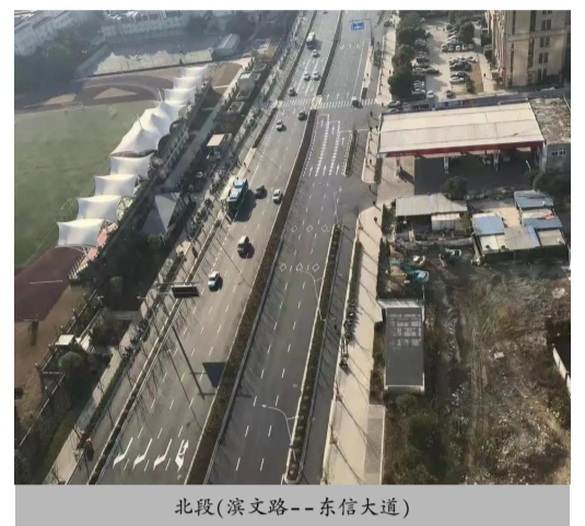
北段(滨文路--东信大道)