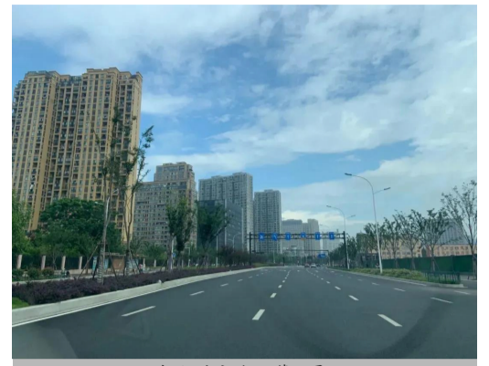
南段(滨文路--萧山界)

作为高新区(滨江)重点基础设施项目,也是高新区(滨江)打通智慧新天地主动脉的重要举措,浦沿路的通车能大大缓解交通拥堵现象,为智慧新天地的建设创造了优越条件,对于完善高新区(滨江)西