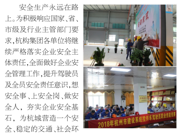
(杭构集团 简报记者)

据了解,启动仪式后,来自各单位的19名驾驶员还在杭构集团职工学校第一教室进行了首批驾驶员理论知识笔试。凭借着扎实的理论知识储备,19人中有12人笔试成绩超过了100分(满分120分),其中杭构·建工砼公司派出的7位驾驶员中占了6名,杭构·砼二分公司占了5名,杭构新材公司占了1名,成绩斐然。接下来,各单位其他驾驶员也将在各自职工学校同步进行测试,期待也能取得优异的成绩。